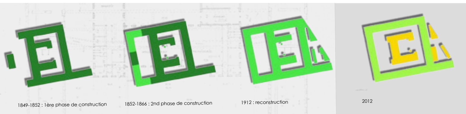
1849-1852 : 1ère phase de construction